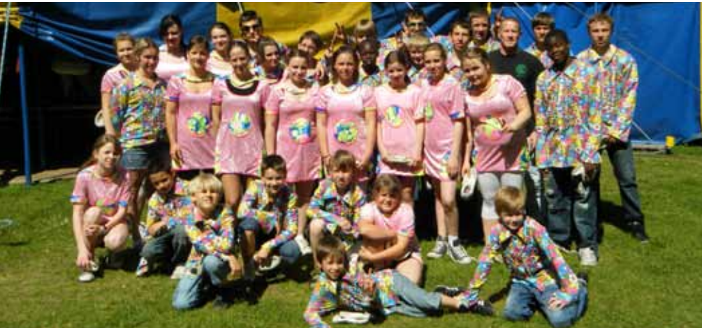
Beeindruckte einmal mehr mit seinem tollen Sprungvermögen, das Nachwuchs-Showteam des TCW

Nachwuchs-Showteam zu Gast beim 7. Hamburger Kinderzirkusfestival in Wilhelmsburg