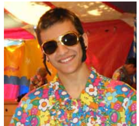
... und Elvis lebt doch noch!