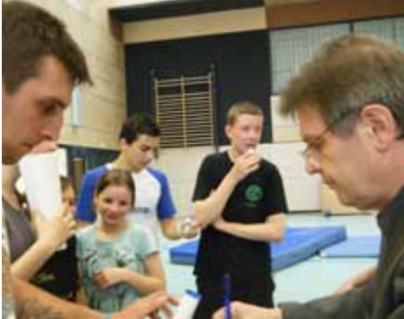
Alle persönlichen Daten wurden notiert

Hobbysportler konnten sich kostenlos testen lassen